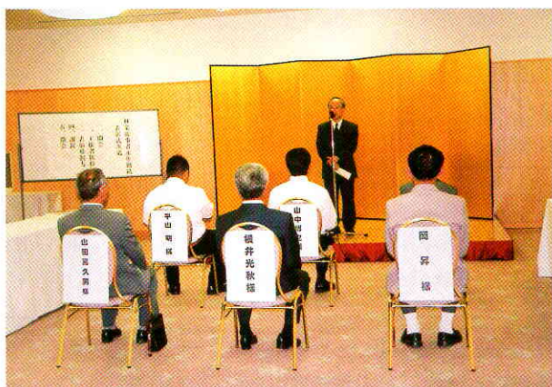
表彰式 (理事長挨拶)