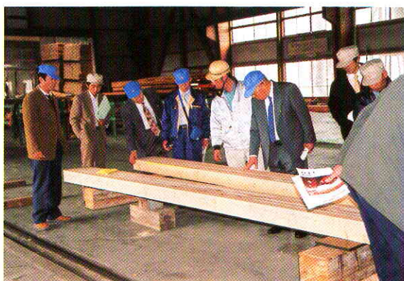
研修の様子（山佐木材）

今回の事例視察研修は、出席者一同「大変参考になる有意義な研修だった」という声が上がっていました。