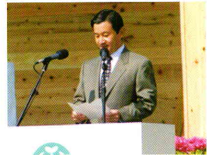
昨年の広島での皇太子殿下