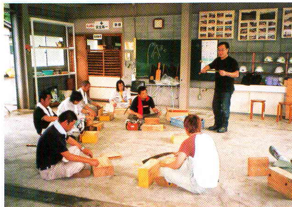
研修の様子（刃物研ぎ）