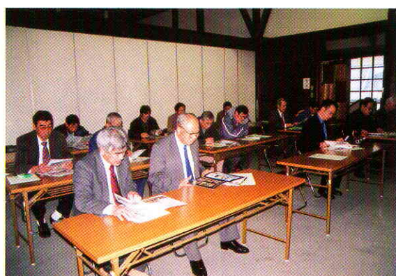
研修の様子（南那珂森林組合）