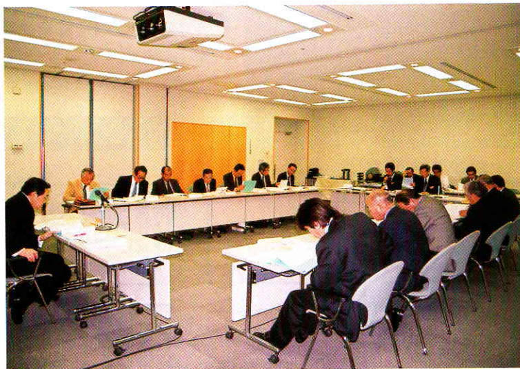
第2回理事会の様子

19年度事業計画の方針については、従前から取り組んでいる就労環境の整備指導、労働安全衛生の指導推進はもとより、現在、県においては新生産システムの構築を図り、林業生産の拡大と木材価格の安定、供給の安定化を進めることとしているため、この県政の方向に沿って労働力の安定確保に向けた取り組みを進めることが重要であるとしています。