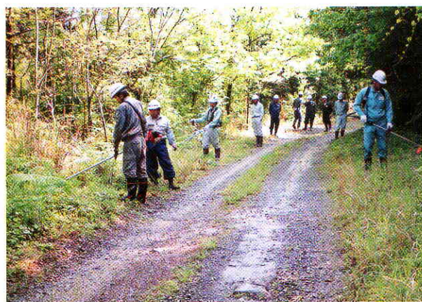
人吉市内の現地（刈払機実習）