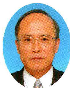
熊本県農林水産部長

県としましても、引き続き国、市町村、関係団体等との強力なパートナーシップのもと、林業就業者の確保・育成対策に努めてまいりますので、皆様の一層のご理解とご協力をお願いします。