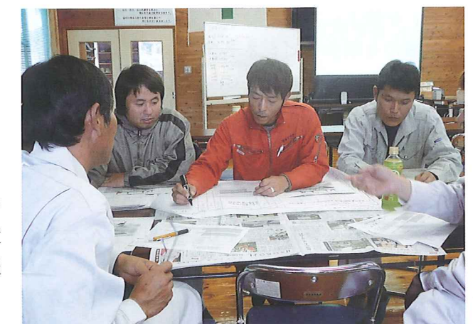
研修会の様子(鹿本会場)

なお、緑川地区では、熊本県の林業労働災害防止キャンペーンにあわせて、林業労働災害の防止活動の取り組みについて研修しました。