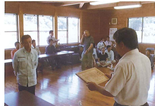
表彰状授与式 (鹿本森林組合)