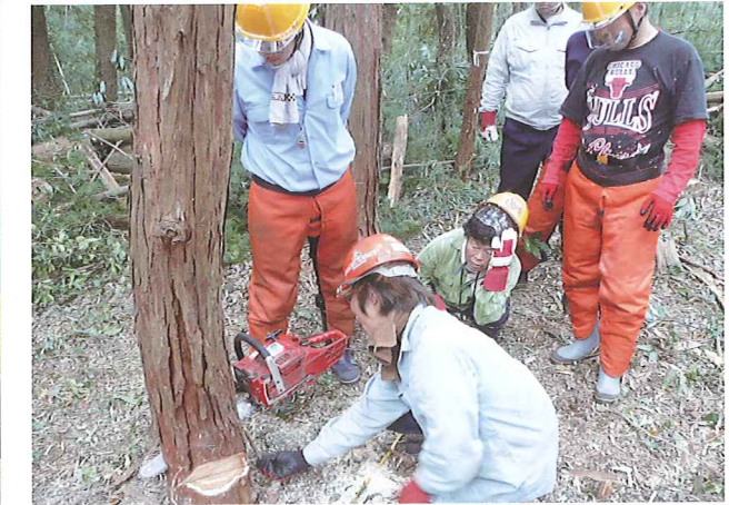
チェーンソーでの伐倒研修