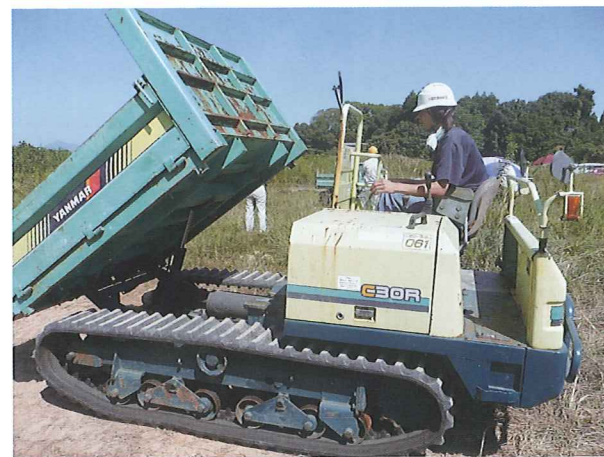
不整地運搬車運転技能講習