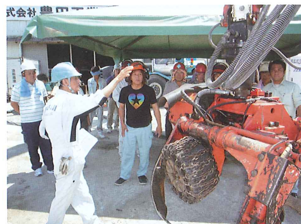
高性能林業機械メンテナンス研修

集合研修日数 4日 研修期間 平成25年5月24日～平成25年9月19日 研修人数 37人