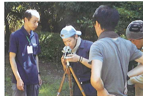
コンパス測量研修

集合研修日数 30日 研修期間 平成25年6月10日～平成26年1月21日 研修人数 42人