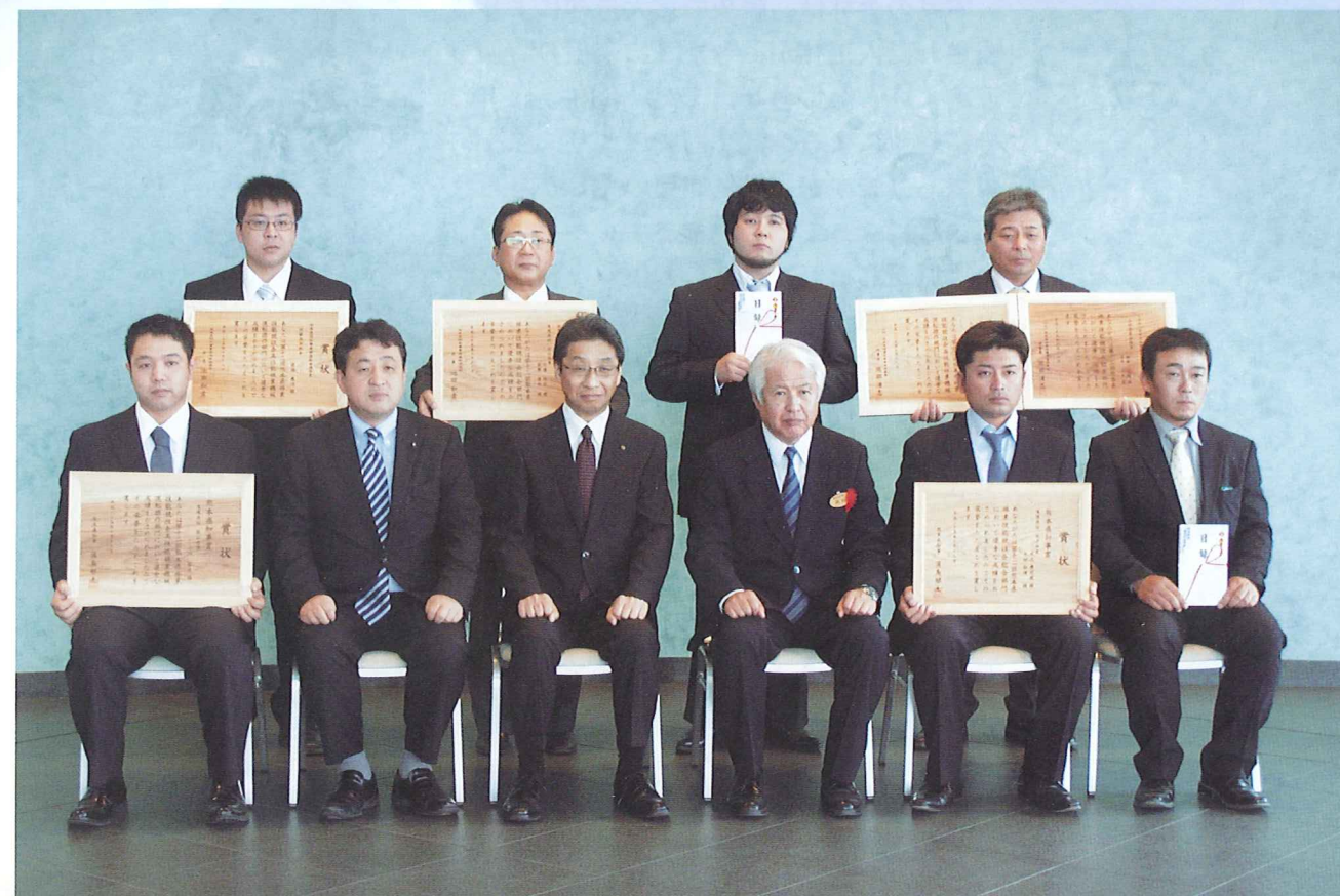
第12回林業技能競技会表彰者