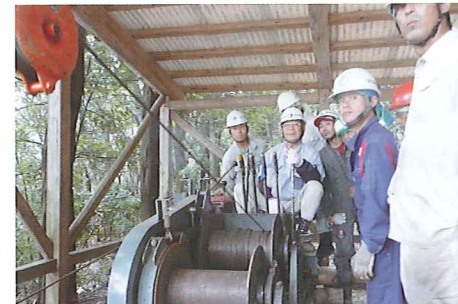
機械集材装置運転技能講習

集合研修日数 20日 研修期間 平成25年6月25日～平成26年1月22日 研修人数 22人