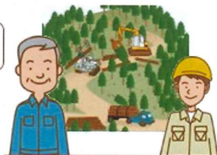
意欲と能力のある 林業経営者