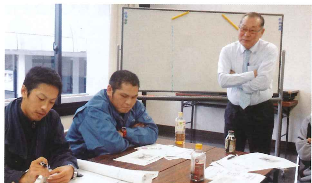
研修会の様子(八代会場)