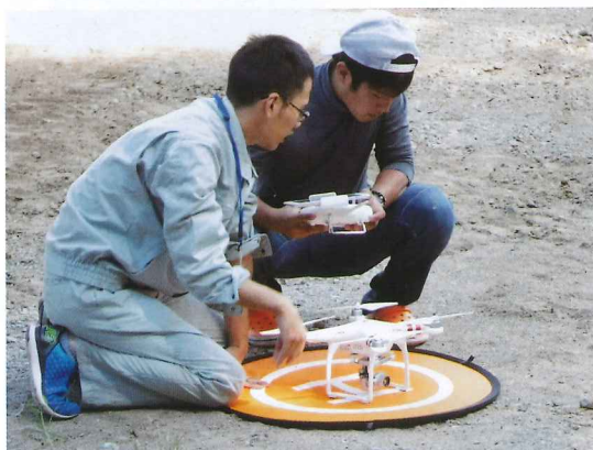
研修の様子(ドローン操作)