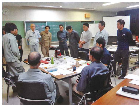
指導員能力向上研修