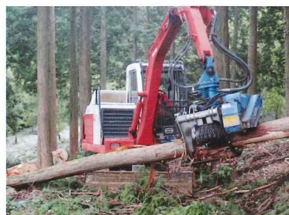
高性能林業機械運転操作部門