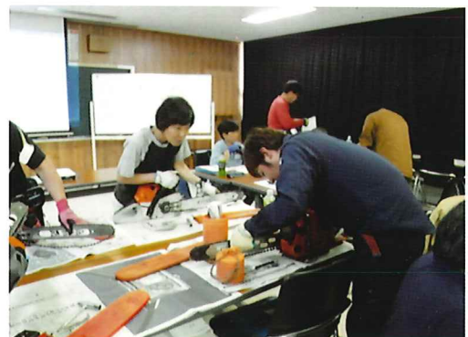
指導員能力向上研修