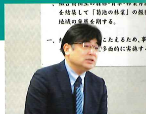
労働基準監督署 講和

研修会では、リスクアセスメントの実践方法について専門講師の指導を受けながら、参加者全員がグループ毎に想定された課題に真剣に取り組み、実際の現場に活かす方法を体験しました。