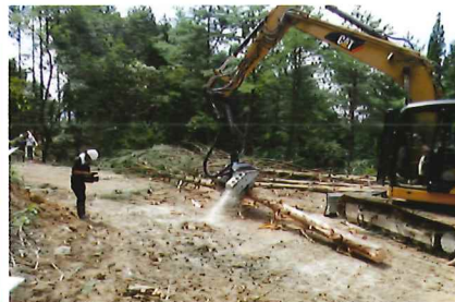
高性能林業機械運転操作部門