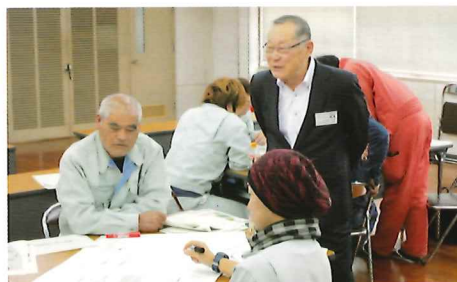
研修会の様子(菊池会場)