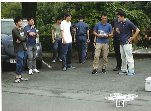
研修の様子(ドローン操作)