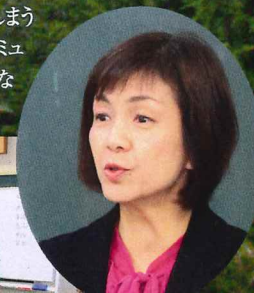
「他人と過去は変えられないけれど、今の自分と未来は変えられる」と森田先生

その中では、思い込みや固定観念で相手を見てしまうとコミュニケーションがうまくいかないことや、相手とコミュニケーションを図る上で、(相手に)不快な思いをさせないマナーが必要なことなどを、特に強調されました。