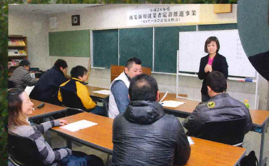
各班でワークショップ形式でコミュニケーションの大切さを学びました