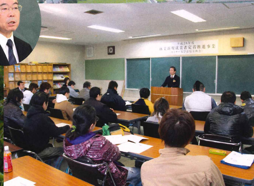
当日は、平成30年度に新規就業した25名が参加