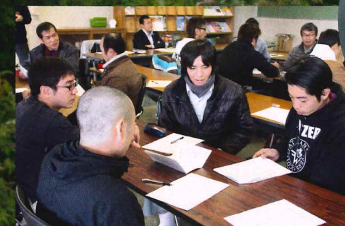
課題を基に班毎でのディスカッションを行う参加者